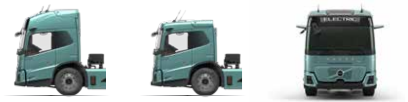
הובג רצק גהנ את